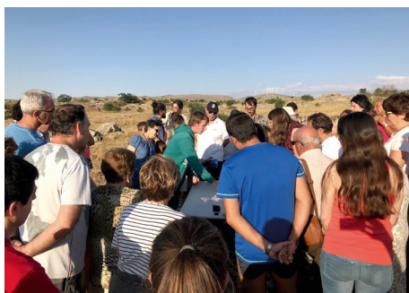
Figura 5: Momento de intercambio de conocimiento entre técnicos y paisanaje.

Ha sido un año trepidante cargado de emociones. Un año que nos ha demostrado a nosotros mismos la riqueza que contienen nuestros paisajes culturales y las gentes que allí viven. Al fin y al cabo, son las que le dan sentido. En el punto de mira de todos los que formamos Terra Levis sigue el sitio arqueológico de “La Mata”. Desencuentros con los administradores de la propiedad no han hecho posible que los trabajos arqueológicos hallan ido más allá de fotografías aéreas y levantamiento topográfico del sitio. Según las gentes del país, se está haciendo buen trabajo y no a mucho tardar podremos realizar avances más firmes en la zona. Por otro lado, estamos convencidos de que empleamos un aparato metodológico adecuado a nuestra zona.