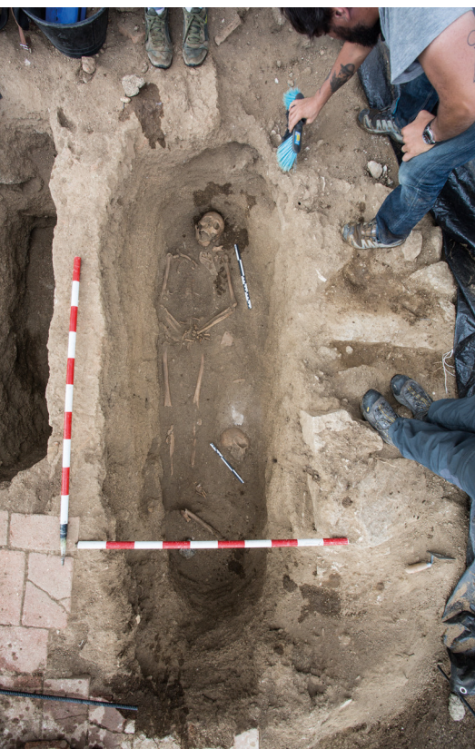
Figura 4: Excavación de la fosa 001 en “El Humilladero de San Juan del Olmo”.

Por otro lado, arqueológicamente estamos buscando el lugar de enterramiento de los compañeros de Garrido muertos durante “el suceso de Grajos”. De momento hemos localizado un cementerio desacralizado que se encontraba en el interior de un antiguo humilladero. Durante la primera campaña desarrollada en el verano de 2018, se han excavado en su totalidad 3 tumbas. De las mismas se han exhumado tres cuerpos completos en deposición primaria y uno más en deposición secundaria, resultado del aprovechamiento de la fosa para un segundo enterramiento. En el momento en el que se escribe este texto, estamos a la espera de los resultados forenses, quienes aportarán datos antropométricos de los hallazgos y nos hablarán de la posible